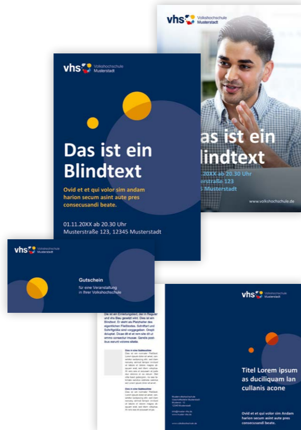
Flyer, Gutschein, Poster, Programmhefte in vielen verschiedenen Varianten